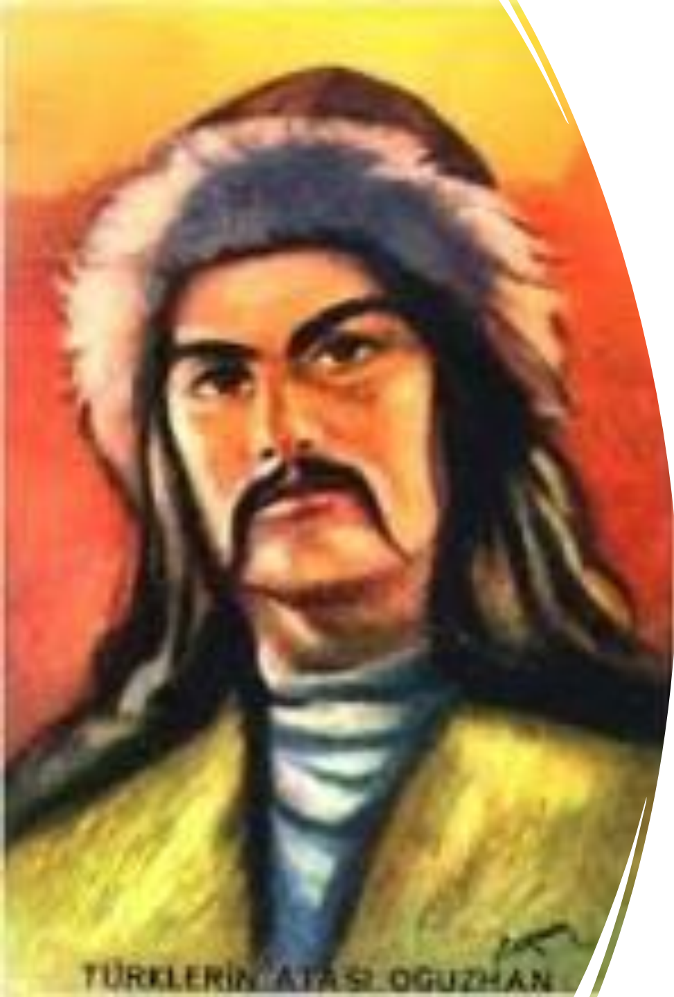
TÜRKLERİN ATASI OĞUZHAN